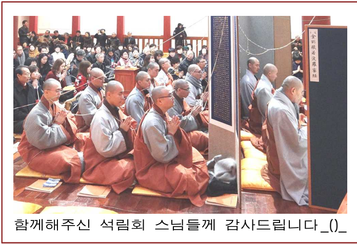
함께해주신 석림회 스님들께 감사드립니다_( )_